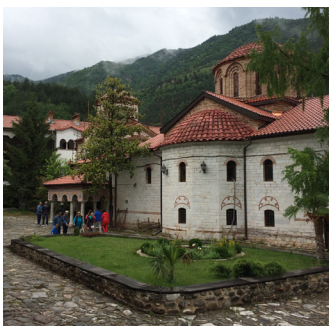
Das Kloster Bachkovo gehört zu den wichtigsten Wallfahrtszentren in Südosteuropa und gilt als Nationalheiligtum.